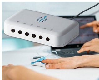
Biofeedback device for stress parameters

Engenharia de medição e controle, tecnologia de controle, tecnologia médica e de laboratório, tecnologia ambiental, tecnologia da informação, IoT/IloT, etc.