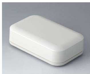
A9433107 EVOTEC 125, Vers. I ASA+PC (UL 94 V-0) off-white RAL 9002 125x78x37mm IP 65 opt., IP 40