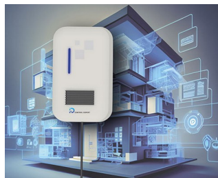
Electronic control system