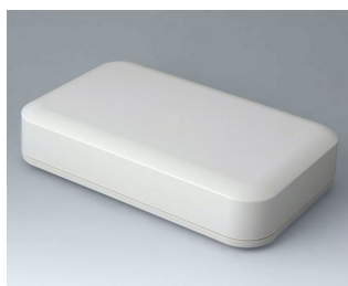
A9481107 EVOTEC 250, Vers. I ASA+PC (UL 94 V-0) off-white RAL 9002 250x155x54mm IP 65 opt., IP 40