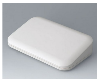
A9465107 EVOTEC 200, Vers. II ASA+PC (UL 94 V-0) off-white RAL 9002 200x124x45mm IP 65 opt., IP 40