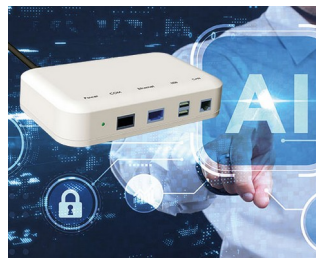
Interface for smart systems