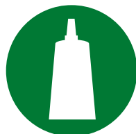
Instalação / Montagem de acessórios