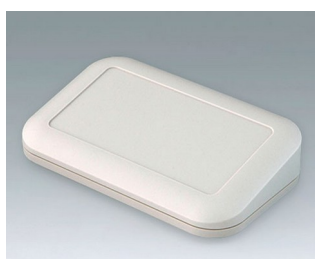
A9446107 EVOTEC 150, Vers. III ASA+PC (UL 94 V-0) off-white RAL 9002 150x93x36mm IP 65 opt., IP 40