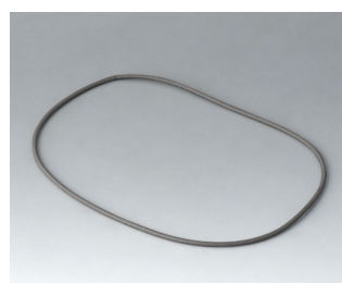
A9504030 Sealing 150