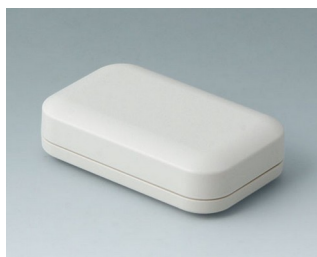
A9401107 EVOTEC 80, Vers. I ASA+PC (UL 94 V-0) off-white RAL 9002 80x50x22mm IP 65 opt., IP 40