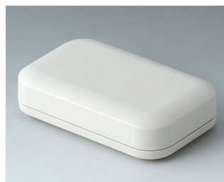
A9421107 EVOTEC 100, Vers. I ASA+PC (UL 94 V-0) off-white RAL 9002 100x62x26mm IP 65 opt., IP 40