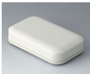
A9431107 EVOTEC 125, Vers. I ASA+PC (UL 94 V-0) off-white RAL 9002 125x78x30mm IP 65 opt., IP 40