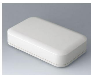
A9461107 EVOTEC 200, Vers. I ASA+PC (UL 94 V-0) off-white RAL 9002 200x124x45mm IP 65 opt., IP 40