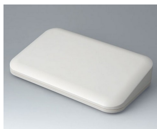
A9485107 EVOTEC 250, Vers. II ASA+PC (UL 94 V-0) off-white RAL 9002 250x155x54mm IP 65 opt., IP 40