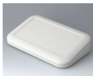
A9466107 EVOTEC 200, Vers. III ASA+PC (UL 94 V-0) off-white RAL 9002 200x124x45mm IP 65 opt., IP 40