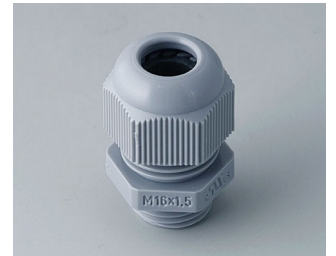
C2316418 Cable gland M16x1.5 PA 6 silver grey RAL 7001