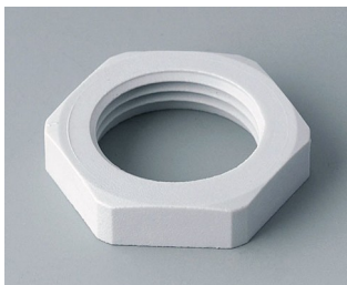
C2320117 Counternut M20x1.5 PA 6 light grey RAL 7035