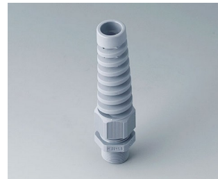
C2320528 Cable gland M20x1.5, bending protection PA 6 silver grey RAL 7001