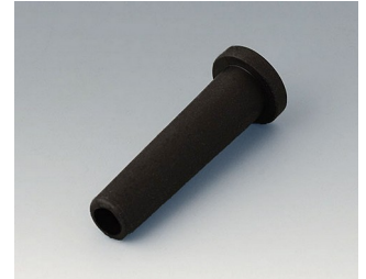
C2353849 Flexible cable grommet Ø 5,3 black