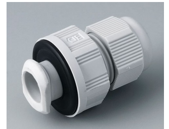
C2316717 Quick fix cable gland, M16 PA 6 light grey RAL 7035