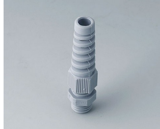
C2312518 Cable gland M12x1.5, bending protection PA 6 silver grey RAL 7001