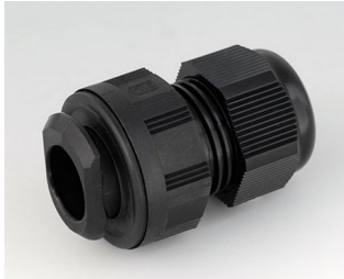
C2320719 Quick fix cable gland, M20 PA 6 black RAL 9005 IP 68