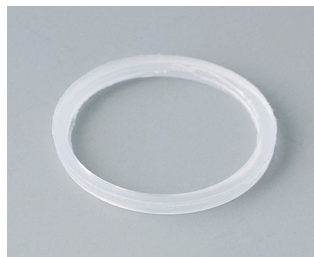
C2320126 Sealing ring for external thread M20x1.5 PE natural-coloured

Sujeito à modificações técnicas sem aviso prévio. © de OKW Gehäusesysteme, Buchen/Alemanha.