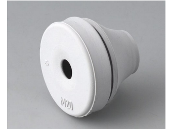
C2320137 Cable grommet EPDM light grey RAL 7035