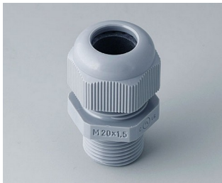
C2320428 Cable gland M20x1.5 PA 6 silver grey RAL 7001