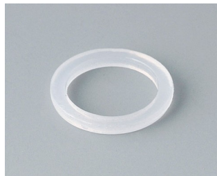
C2312126 Sealing ring for external thread M12x1.5 PE natural-coloured