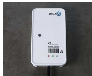
Wired device in the IIoT