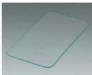
C6506013 Glass panel E155 Glass clear 149,75x78,75x1,6mm