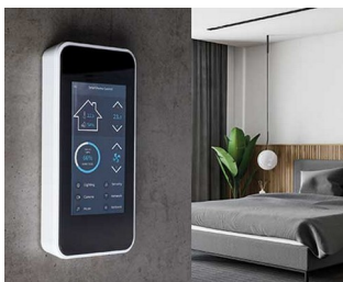
SMART-HOME control centre