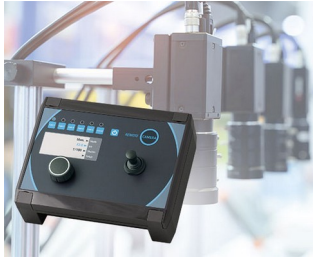
Camera control in production

Ideal para aplicações elétricas e eletrônicas de alta qualidade em áreas internas e externas protegidas por exemplo construções mecânicas e engenharia de instalações, tecnologia de aquecimento, tecnologia de climatização e de ventilação, Internet das Coisas/Internet Industrial das Coisas, Smart-Factory / Indústria 4.0, gateways, registador de dados, tecnologia da informação e comunicação (TIC), instalação elétrica, tecnologia de medição e regulação, agricultura, sistema de sensores e técnica de segurança.