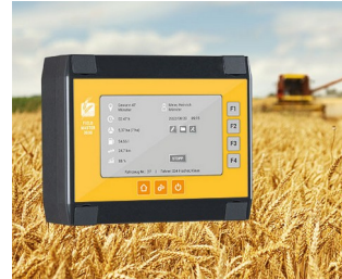
Data recording for harvesters