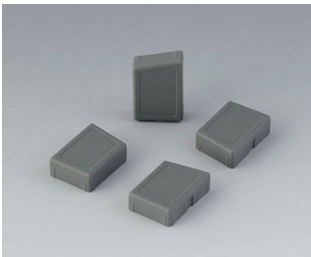
C8100188 Set of enclosure feet SEBS (TPE) volcano

Sujeito à modificações técnicas sem aviso prévio. © de OKW Gehäusesysteme, Buchen/Alemanha.