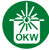
Letragem a laser