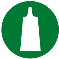
Instalação / Montagem de acessórios