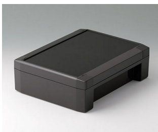
C8017221 SOLID-BOX 175 PC+ABS (UL 94 V-0) anthracite grey RAL 7016 225x175x70mm IP 66, IP 67, IK 08