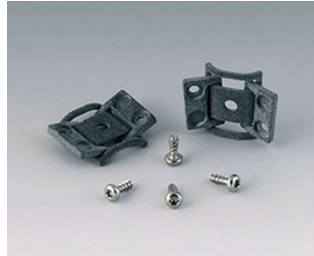
C8100360 Internal hinge set