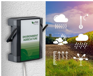
Weather station in agriculture