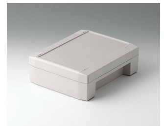
C8014182 SOLID-BOX 145 PC+ABS (UL 94 V-0) light grey RAL 7035 180x145x60mm IP 66, IP 67, IK 08