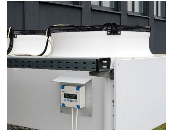
Heating/air conditioning/ventilation control