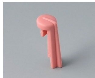
A1105003 Arrow PA 6 (UL 94 HB) coral