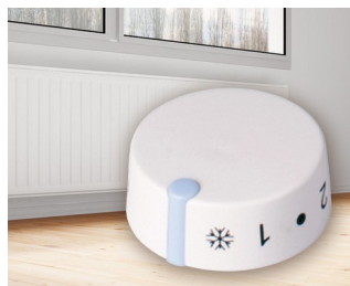
Integrated thermostat for electric storage heaters