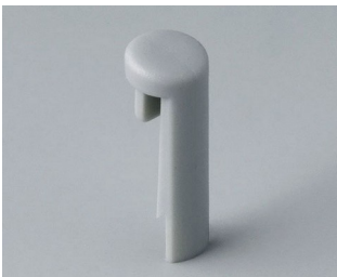
A1101007 Pin PA 6 (UL 94 HB) mineral