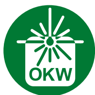
Letragem a laser