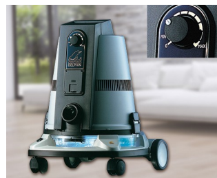
Operating element for a vacuum cleaner