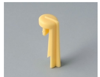
A1105004 Arrow PA 6 (UL 94 HB) beach