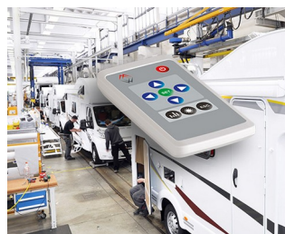
Remote control for interior design