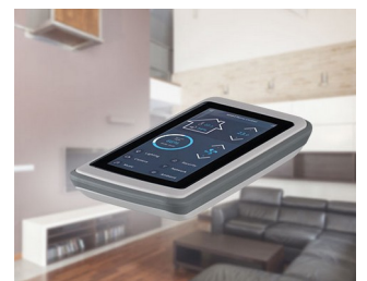
Smart Home Control