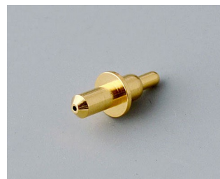
A9193031 Пружинный контакт позолоченный