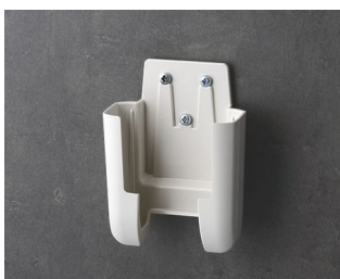
A9105627 Настенный держатель S ACA+ПК (UL 94 V-0) белый RAL 9002