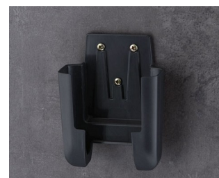
A9106628 Настенный держатель M ACA+ПК (UL 94 V-0) лава