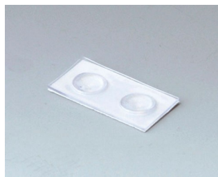
A9207150 Резиновые ножки 6,5 x 2 мм прозрачный

Возможно внесение изменений без предварительного уведомления. © by OKW Gehäusesysteme, Buchen/Germany.