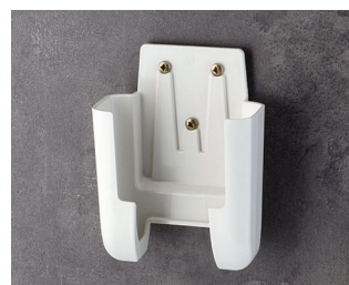
A9106627 Настенный держатель M ACA+ПК (UL 94 V-0) белый RAL 9002