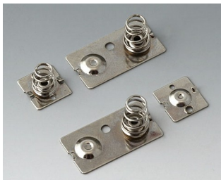
A9190023 Набор батарейных контактов, 3 x AA Сталь никелированный