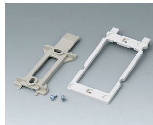
B1350048 Набор для настенного монтажа АБС (UL 94 HB) тепло-серый RAL 7032