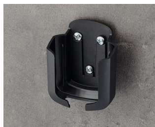
B2931509 Holder M ASA+PC (UL 94 V-0) black RAL 9005