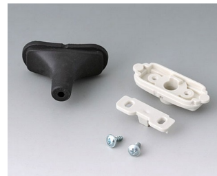
B2911309 Cable gland kit, 3.4 - 4.2 TPE black RAL 9005