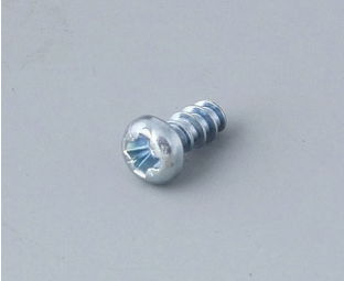
A0304031 Self-tapping screws 2.2 x 5 mm (PZ1)