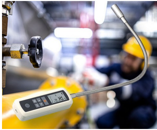
Gas leak detector

电脑配件。网络技术。建筑技术。安全技术。IoT/IIoT。医学和治疗应用。实验室用分析仪器。用于测量技术，包括带有检测探头的探测器、测试系统和测试仪器。环保技术用数据记录器。传感器技术。