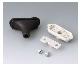
B2911329 Cable gland kit, 5.0 - 5.9 TPE black RAL 9005