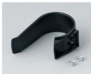
A9167029 Holding clamp PA 6 (UL 94 HB) black RAL 9005