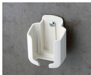
B2921507 Holder S ASA+PC (UL 94 V-0) off-white RAL 9002