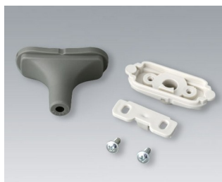
B2911318 Cable gland kit, 4.2 - 5.0 TPE volcano