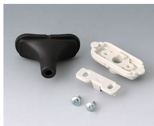
B2911319 Cable gland kit, 4.2 - 5.0 TPE black RAL 9005