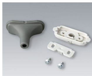
B2911328 Cable gland kit, 5.0 - 5.9 TPE volcano