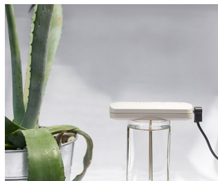
Tool for making colloidal silver solutions