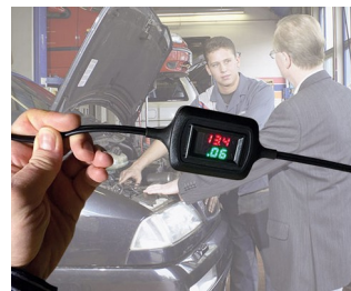
Voltage and current display during trickle charging