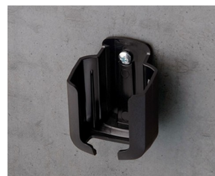
B2921509 Holder S ASA+PC (UL 94 V-0) black RAL 9005