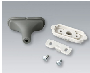
B2911308 Cable gland kit, 3.4 - 4.2 TPE volcano