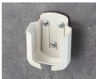
B2931507 Holder M ASA+PC (UL 94 V-0) off-white RAL 9002