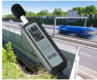
Noise level measurement