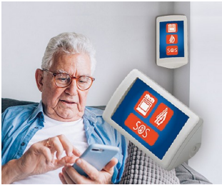
AAL assistance system

环保技术。IoT/IIoT。出入控制设施。测量和控制技术。自动化技术。医疗和实验室技术。环保技术。