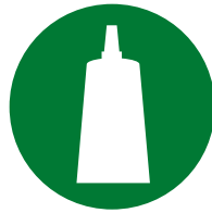
制备 / 组装