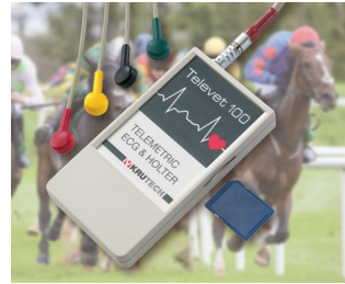
Telemetric ECG system for veterinary medicine