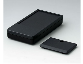
A9072219 DATEC-POCKET-BOX L PMMA (IR) (UL 94 HB) black RAL 9005 120x65x22mm IP 54