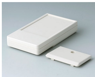
A9071117 DATEC-POCKET-BOX M ABS (UL 94 HB) off-white RAL 9002 105x58x18.5mm IP 54