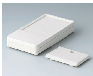
A9072117 DATEC-POCKET-BOX L ABS (UL 94 HB) off-white RAL 9002 120x65x22mm IP 54