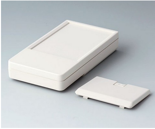
A9072127 DATEC-POCKET-BOX L ABS (UL 94 HB) off-white RAL 9002 120x65x22mm IP 41