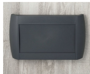
A9095108 DIATEC L ABS (UL 94 HB) lava 330x48x200mm IP 40