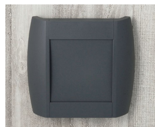
A9093108 DIATEC S ABS (UL 94 HB) lava 210x48x200mm IP 40