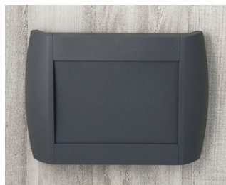
A9094108 DIATEC M ABS (UL 94 HB) lava 270x48x200mm IP 40