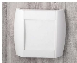
A9093107 DIATEC S ABS (UL 94 HB) off-white RAL 9002 210x48x200mm IP 40