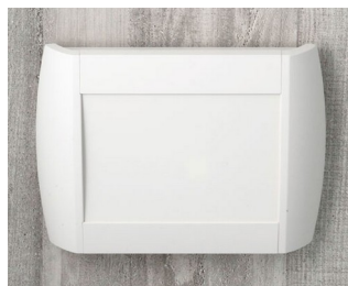
A9094107 DIATEC M ABS (UL 94 HB) off-white RAL 9002 270x48x200mm IP 40