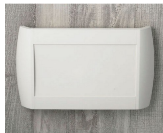
A9095107 DIATEC L ABS (UL 94 HB) off-white RAL 9002 330x48x200mm IP 40