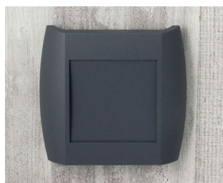
A9092108 DIATEC XS ABS (UL 94 HB) lava 150x37x155mm IP 40