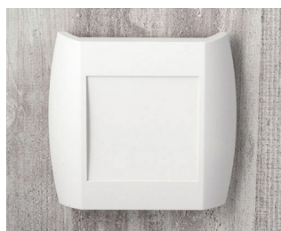
A9092107 DIATEC XS ABS (UL 94 HB) off-white RAL 9002 150x37x155mm IP 40