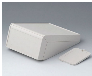
B4056217 UNITEC M, 1.4/1.4 ABS (UL 94 HB) off-white RAL 9002 148x210x80mm IP 40