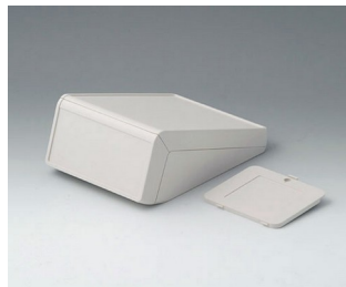
B4054317 UNITEC S, 1.4/1.4 ABS (UL 94 HB) off-white RAL 9002 125x177x69mm IP 40