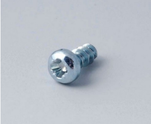
A0305031 Self-tapping screws 2.5 x 6 mm (PZ1)