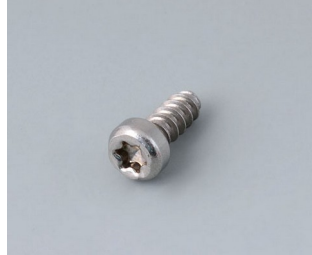
A0325060 Self-tapping screw 2.5 x 6 mm (T8) Stainless steel