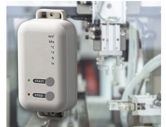
Data logger with gateway function