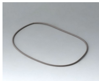
A9503030 Sealing 125