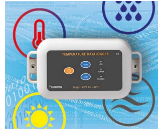
Data logger e.g. for temperature