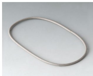
A9502030 Sealing 100