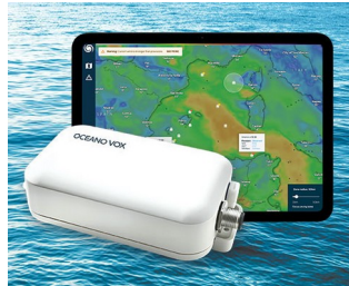
Data Collection for Ocean Observation network