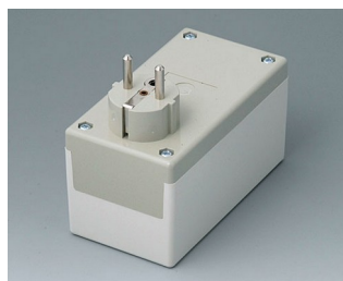
A9021665 PLUG CASE F / D, Vers. I PC+ABS (UL 94 V-0) pebble grey RAL 7032 120x65x65mm