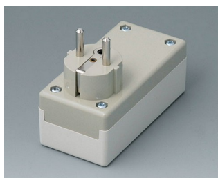
A9011665 PLUG CASE F / D, Vers. I PC+ABS (UL 94 V-0) off-white RAL 9002 100x50x40mm