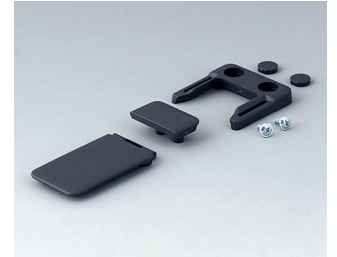
A9152048 Combi-Clip ABS (UL 94 HB) lava 45x27mm