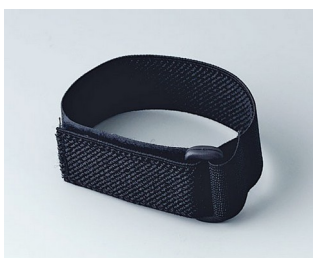
B9100033 Wrist strap