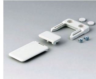
A9152047 Combi-Clip ABS (UL 94 HB) off-white RAL 9002 45x27mm