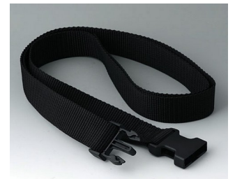
B7110149 Belt strap