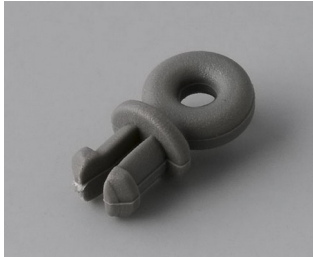
A910001 Ring eyelet PA 6 volcano