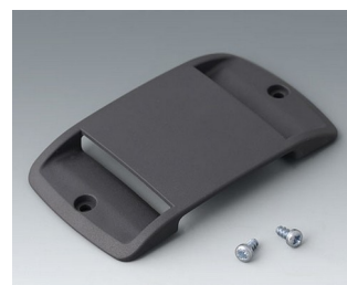
B9106128 Strap eyelet ABS (UL 94 HB) lava