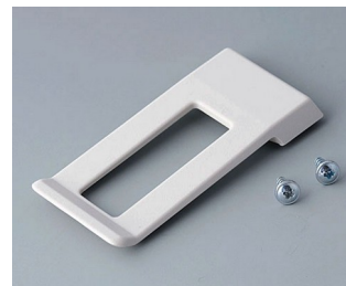
A9172107 Belt/Pocket clip ABS (UL 94 HB) off-white RAL 9002 62x30mm