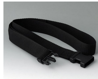
B7110139 Belt strap