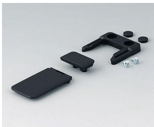
A9152049 Combi-Clip ABS (UL 94 HB) black RAL 9005 45x27mm