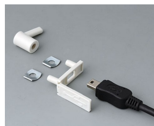
A9320207 USB cover, type Mini-USB PP off-white RAL 9002 29.5x8.5mm