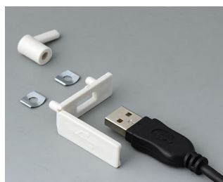
A9320107 USB cover PP off-white RAL 9002 35x13mm